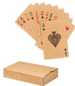
Aruba + MO6201 Speelkaarten van gerecycled papier in een kartonnen doosje. 54 speelkaarten.