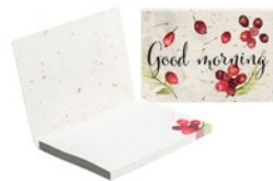
SNCS50 SNCS50 Zachte kaft gemaakt van gerecycled papier dat koffie afval bevat (afmeting 100x72mm, gesloten), met 50 sticky notes van gerecycled papier (80gsm) en gerecycled papieren bodem (160gsm).