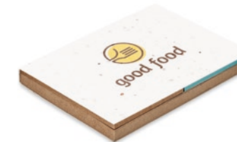
Grow Me MO6235

Notitieboek met bamboe cover en 70 vel gelinieerd gerecycled papier. Inclusief bijpassende balpen in bamboe met ABS top met blauwe inkt en drukmechanisme.