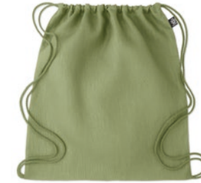
Naima Bag MO6163

Boodschappentas van 100% hennep met lange draaghengsels. 200 gr/m 2 .