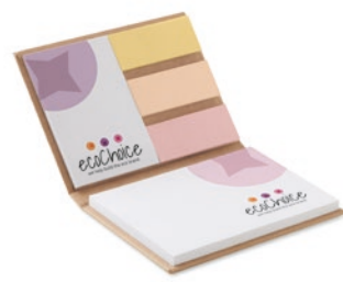
COMBE1 COMBE1 Gerecycled ComboNote (106x77mm, gesloten) met harde kaft en gerecycled sticky notes (80gsm) van 100x72mm en 50x72mm; en gerecycled markers in 3 verschillende kleuren.