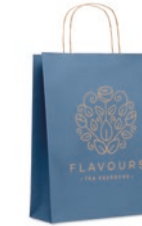
Paper Tone M MO6173

A6 formaat schrift met kartonnen kaft gevuld met 80 vel ingebonden gerecycled papier. Kaft: 250 g/m 2 , papier: 70 grams.