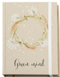
NOTEG5 NOTEG5 Graspapier notitieboekje met harde kaft.