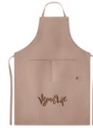
Naima Apron MO6164

Schort van 100% hennep met verstelbare band. 200 gr/m 2 .