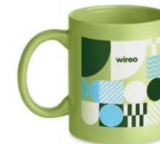
Dublin Tone MO6208

Klassieke keramische mok, 300ml, per stuk verpakt in een kartonnen doosje. Ideaal voor het bedrukken met uw logo.