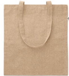
Cottonel Duo MO9424

Boodschappentas van 50% gerecyclede denimkatoen/ 50% katoen met lange hengsels. Gewicht 250 gr/m 2 .