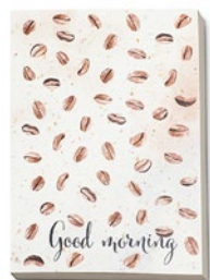
NOPCC5 NOPCC5 A5 notitieboekje met zachte kaft gemaakt van gerecycled papier met koffie afval.