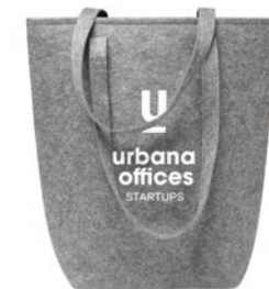
Taslo MO6185 RPET vilten boodschappentas met lange draaghengsels en blokbodem.