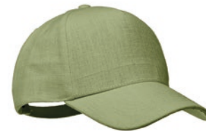
Naima Cap MO6176

Toilettas van 100% hennep, met dubbele ritsluiting. 200 gr/m 2 .