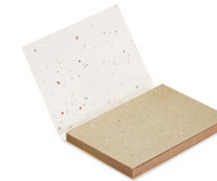
Grow Me MO6234

Softcover memoset van groeipapier met 25 sticky notes en pagina markers in 3 kleuren. Plant de cover na gebruik in de aarde en wilde veldbloemen zullen hier uit groeien. Gemaakt in de EU.