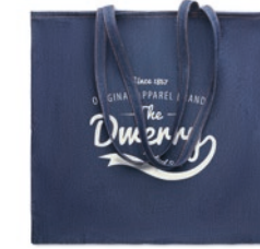
Style Tote MO6420

Trekkoordrugzak van 50% gerecycled denimkatoen/ 50% katoen. Gewicht 250 gr/m 2 .