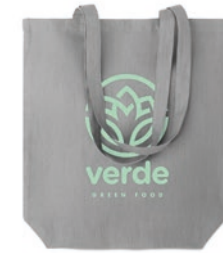
Naima Tote MO6162

Schort van 100% hennep met verstelbare band. 200 gr/m 2 .