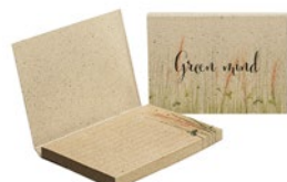
SNGG50 SNGG50 Zachte kaft met sticky notes gemaakt van graspapier..