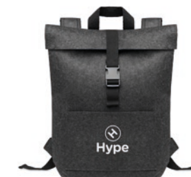
Indico Pack MO6456 Rugzak van RPET vilt met katoenen sluitband, ritsvak aan de voorkant en een laptopcompartiment.