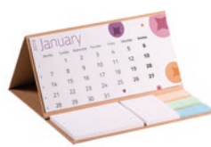
CALECO CALECO Gerecycled CalendNote met harde kaft.