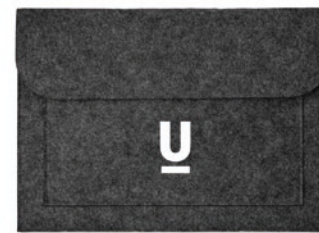
Pouchlo MO9818 Documententas of laptopvoes van 2 mm dik RPET vilt, met voorvakje en klittenbandsluiting.