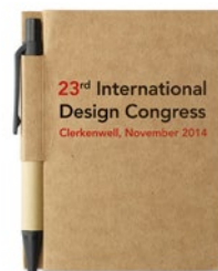
Cartopad MO7626 Dit memoboekje van gerecycled materiaal heeft 80 vel gelinieerd papier. Ook de meegeleverde pen is van gerecycled materiaal. Blauwe inkt.