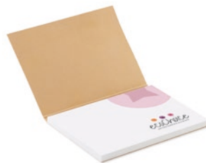
SNES50 SNES50 Gerecycled zachte kaft sticky note (afmeting 100x72mm, gesloten) met 50 sticky notes van gerecycled wit papier (80gsm).