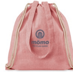
Moira Duo MO9603

Draagtas van gerecycled katoen en gerecycled polyester met trekkoorden en lange draaghengsels. Gewicht ca. 140 gr/m 2 . Dit artikel kan krimpen na het afdrucken.