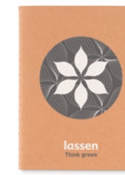
Mini Paper Book MO9868

A5 formaat schrift met kartonnen kaft gevuld met 80 vel ingebonden gerecycled papier. Kaft: 250 g/m 2 , papier: 70 grams.