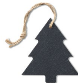
Slatetree CX1433 Kerstboomvormige hanger van leisteen met koord.