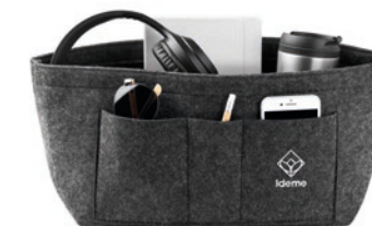
Nizer MO6334 RPET vilten tasorganizer met 2 binnen- en 4 buitenvakken. Handig om je spullen overzichtelijk in je tas op te bergen.