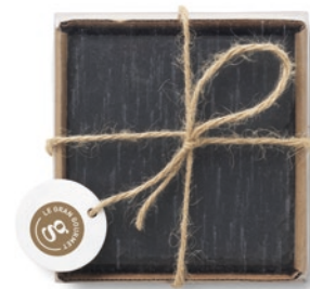
Slate4 MO9124 Set van 4 onderzetters van leisteen met onderkant van EVA.