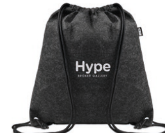
Indico MO6463 RPET vilten rugzak met polyester trekkoordsluiting.