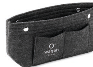
Nazer MO6335 RPET vilten tasorganizer met 5 binnen- en 3 buitenvakken. Handig voor het organiseren van kleine spullen in je tas en snel van tas te wisselen.