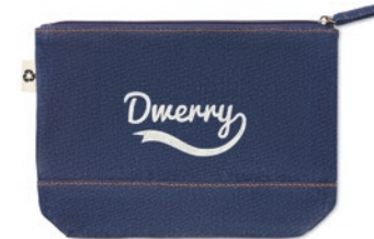
Style Pouch MO6421

2-tone gerecycled katoen en gerecycled polyester boodschappentas met lange hengsels. 140 g/m 2 . Dit artikel kan krimpen na het afdrucken.