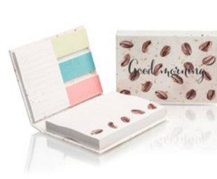
COMBC1 COMBC1 Koffiepapier ComboNote met harde kaft.