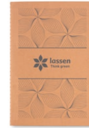
Mid Paper Book MO9867

A5 formaat schrift met kartonnen kaft gevuld met 80 vel ingebonden gerecycled papier. Kaft: 250 g/m 2 , papier: 70 grams.