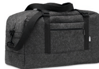
Indico Bag MO6457 Sport-/ weekentas van RPET vilt met voorvak met rits, canvas handvatten en afneembare verstelbare schouderriem.