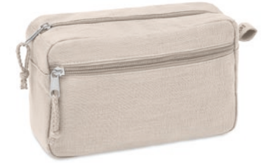
Naima Cosmetic MO6165

Rugzak met trekkoordsluiting van 100% hennep. 200 gr/m 2 .