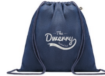
Style Bag MO6422

Draagtas van gerecycled katoen en gerecycled polyester met trekkoorden en lange draaghengsels. Gewicht ca. 140 gr/m 2 . Dit artikel kan krimpen na het afdrucken.