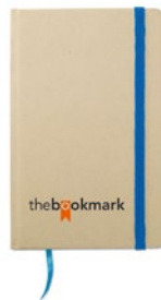
Evernote MO7431 A6 notitieboekje van gerecycled materiaal, met bijpassend gekleurd bladwijzer en een elastieken sluiting. 96 blanke pagina's.