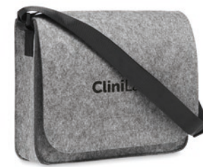
Baglo MO6186 RPET vilten laptoptas met klittenbandsluiting. Geschikt voor 15 inch laptops.